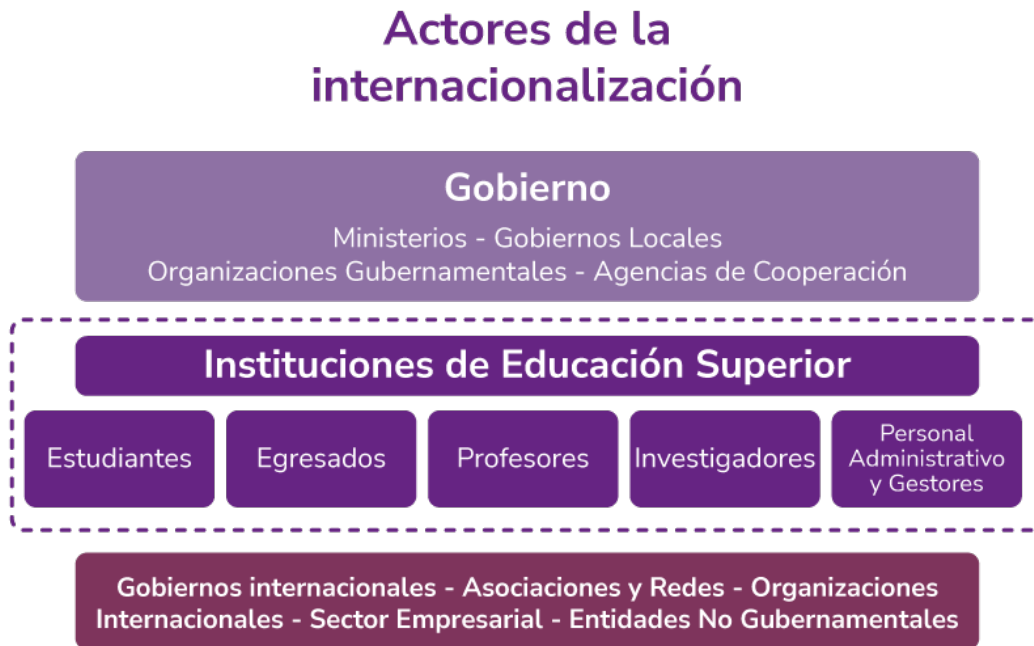
Figura 2 Actores de la internacionalización